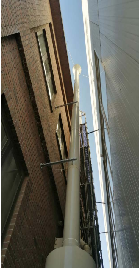
Scurubber Baca Sistemi