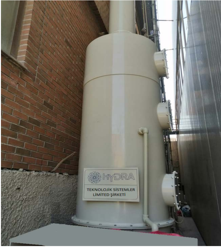
SCRUBER TEKNİK ÖZELLİKLERİ