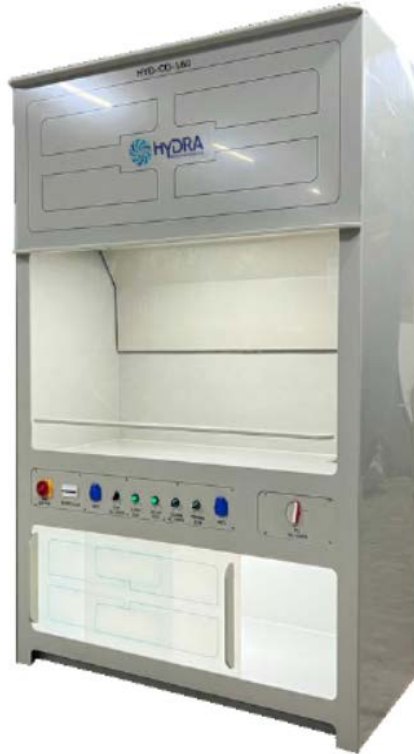
PP eker Ocak 1800 mm