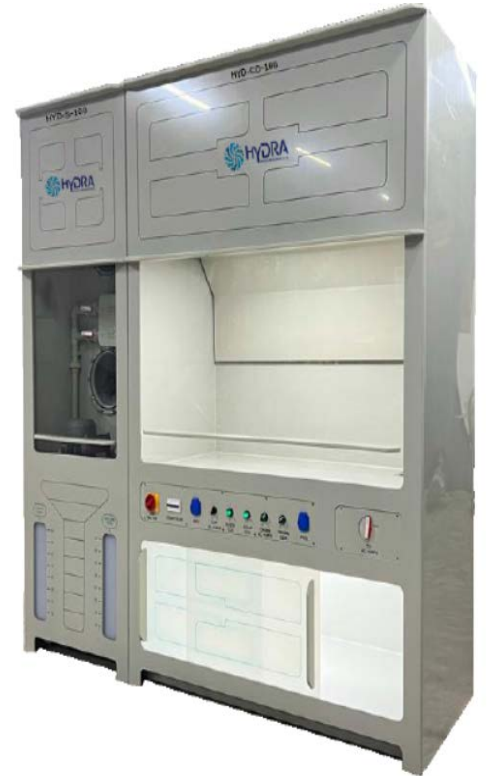
Entegre Gaz Yıkama niteli PP eker Ocak

Daha fazla bilgi iin ltfen satıř ekibimize ulařın.