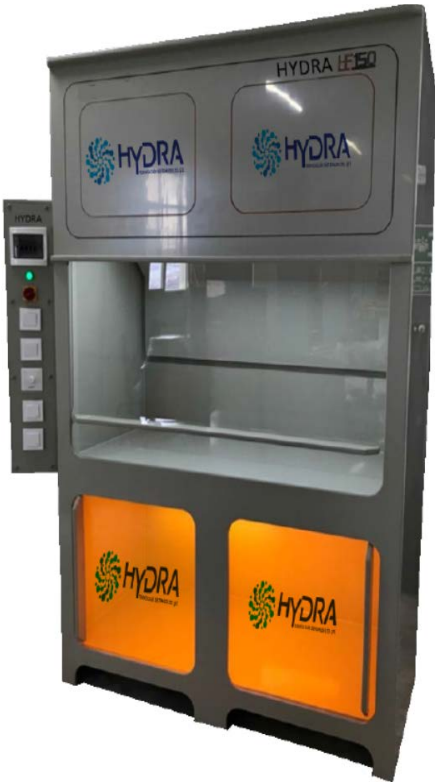
PP eker Ocak 1500 mm