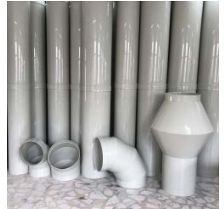
JETCAP BACA ve EGZOS BORUSU

Adres: HYDRA Teknolojik Sistemler Ltd. Şti., Merkez Mahallesi, Firuze Sokak, DAP Yapı S Plaza No: 5 iç kapı No: 173 - (190) PK 34406 Kâğıthane - İstanbul, Türkiye