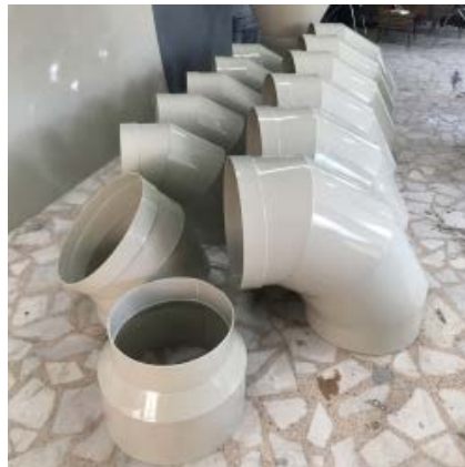
DİRSEK ve BAPLANTI EKİPMANLARI