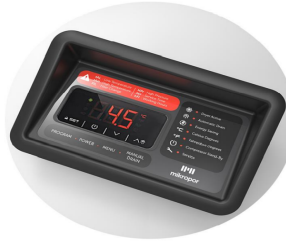
Digi-Pro Kontrol Ünitesi